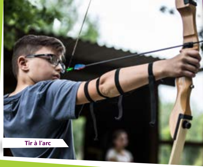
Tir à l'arc