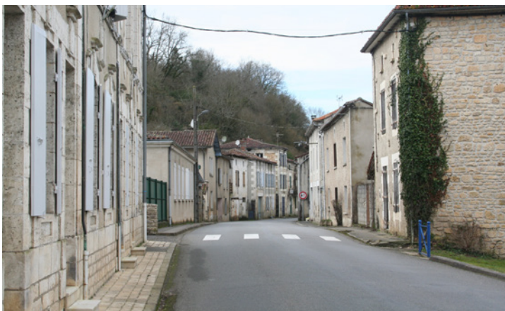
3. La construction axiale du bourg, soulignée par l'alignement des façades