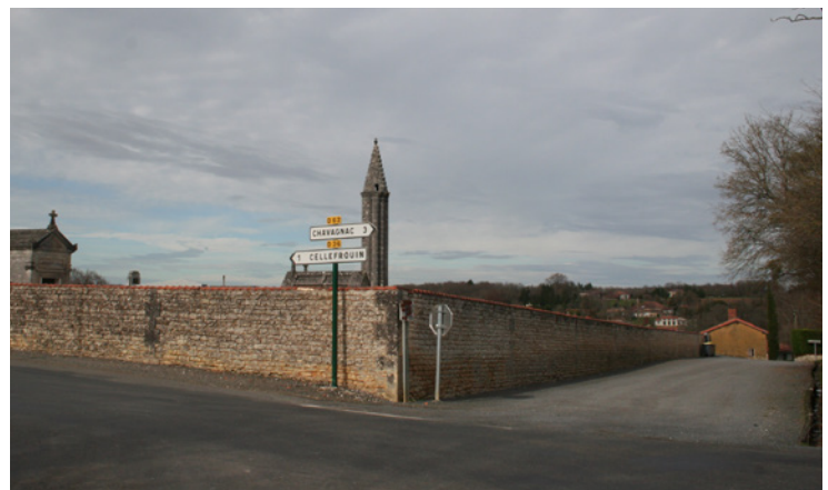
4. La lanterne des morts et sa silhouette qui inscrit une verticale forte dans le cimetière