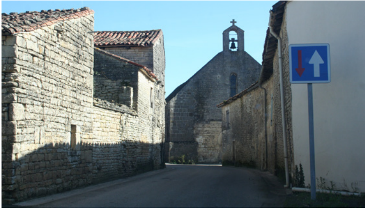
1 . La traversée du bourg par l'axe principal qu'est la D61 permet d'apercevoir l'église Notre Dame

Covisibilités, espace public et ambiances du lieu