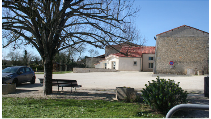
2. La place du village, marquée par la proximité avec la mairie et occupée par le stationnement