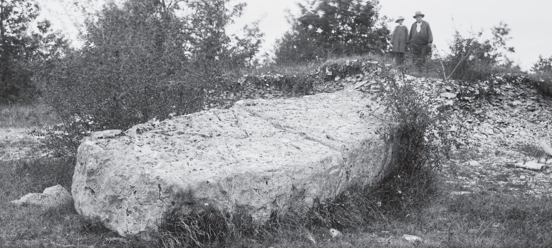
Vervant - Pierre du sacrifice en 1891 avec une partie de son tertre visible et aujourd'hui disparu