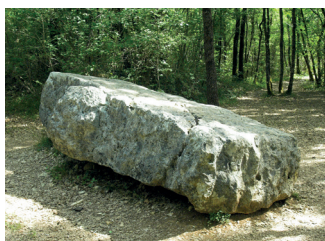
Table du dolmen