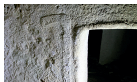
Gravure de hache © E. Mens