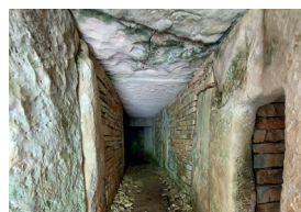
Couloir intérieur du tumulus B de Vervant