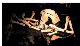
Restes osseux