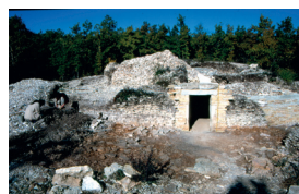
Tumulus en cours de restauration