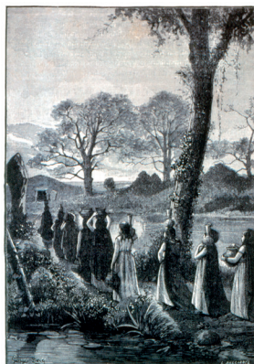
Illustration poétique des cultes et légendes autour des tumulus. Ouvrage : «Création de l'homme et premiers âges» - Armand Laroche XIX e

L'une des dalles du monument, ornée d'une grande crosse, a été recyclée en margelle de puits au XIX e siècle.