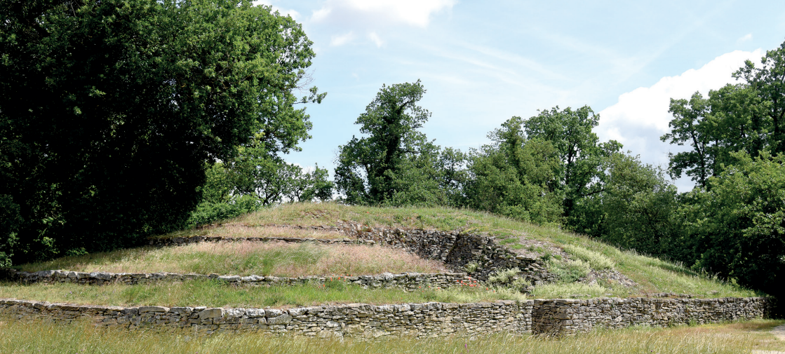
Tumulus A - Bougon (79)