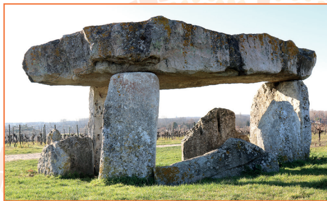
Dolmen de la Pierre levée - St-Fort-sur-le-Né (16)