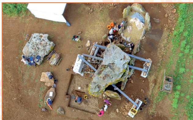
Fouilles du dolmen de Chante-Brault en 2018 - Loudun (86)