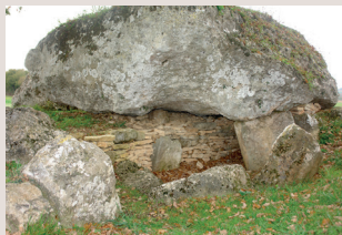
Comblement de la chambre de la Grosse Pérotte