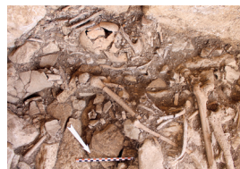
Inhumation en place à la Petite Pérotte