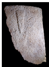
Gravure Grosse Pérotte © A. Laurent