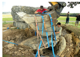
Déplacement de la dalle de couverture de la chambre annexe de la Petite Pérotte