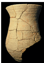
Céramique Petite Pérotte