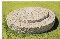
Reconstitution du tumulus à partir d'images 3D