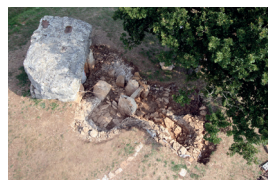
Fouille Petite Pérotte

Les fouilles réalisées ont permis la création d'une reconstitution virtuelle en 3D de la Petite Pérotte (QR code et illustration au dos).