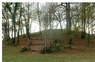
Vue du monument

Le site est entouré de prairies sèches qui accueillent de nombreuses orchidées sauvages protégées.