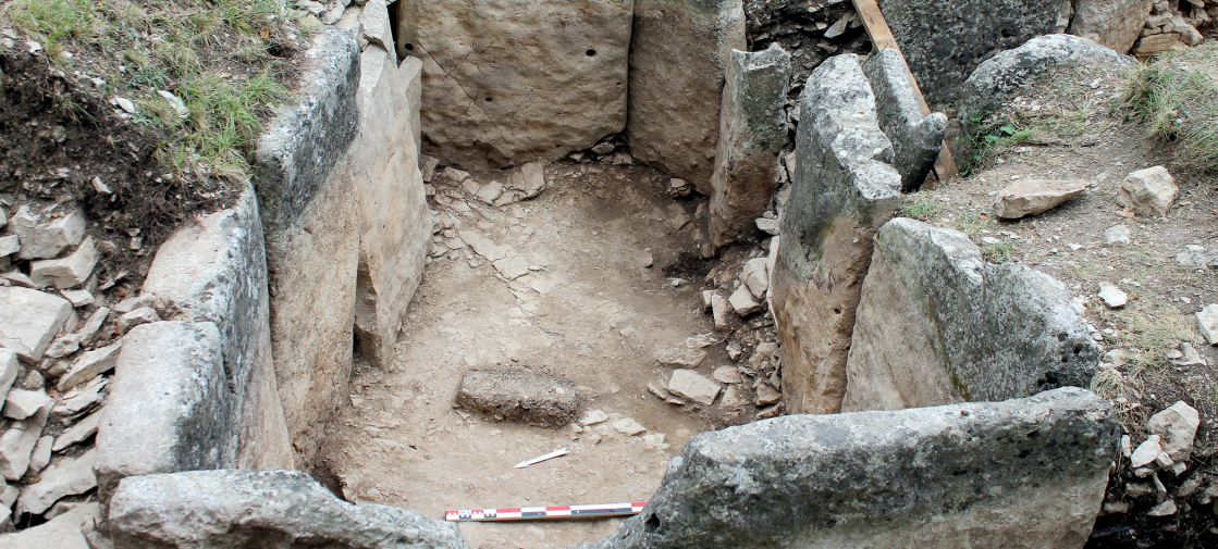
Chambre funéraire