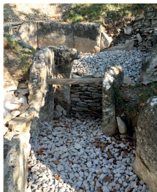
Vue sur le couloir et emplacement de la porte