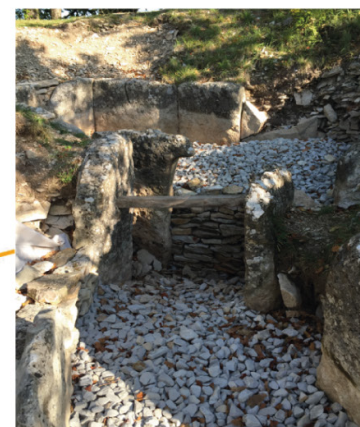
Fontenille : tumulus Motte de la Jacquille et sa porte en pierre à gonds, unique en Europe