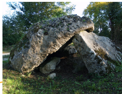
Courcôme : dolmen de Magnez

Au coeur du Ruffécois, près de 40 monuments néolithiques représentent les premières architectures de l'humanité.