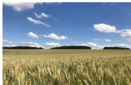
Tusson : ses tumulus géants et l'exposition sur les mégalithes à la maison du patrimoine