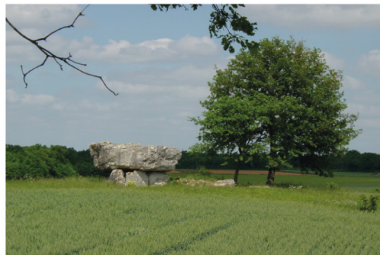
Fontenille : les dolmens des Pierres Pérottes