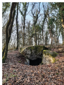
Luxé : Motte de la Garde