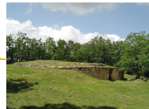
Vervant : Nécropole de la Boixe, tumulus B restauré et Pierre du Sacrifice