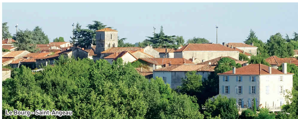
Le Bourg - Saint-Angeau

Saint-Amant-de-Bonnieure, Nanclars : meublés, producteur