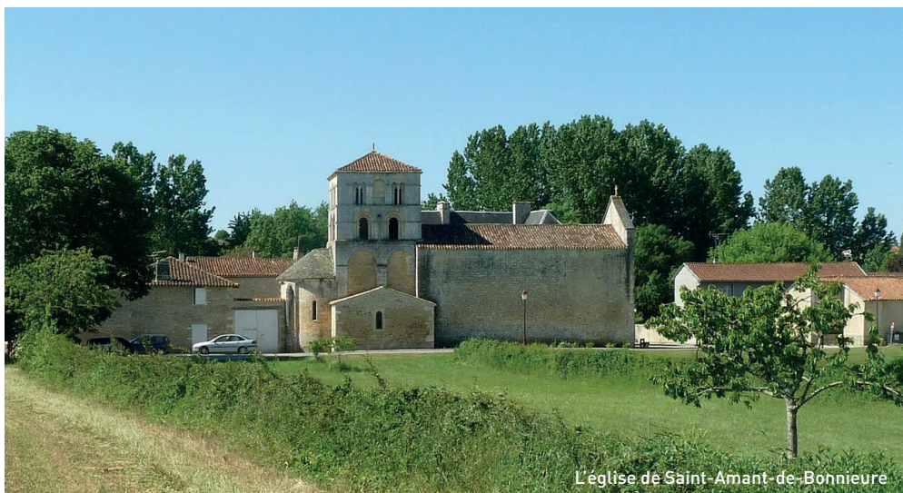
L'église de Saint-Amant-de-Bonnieure

Saint-Amant-de-Bonnieure, Nanclars : meublés, producteur